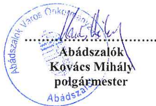
Abádszalók Kovács Mihály polgármester