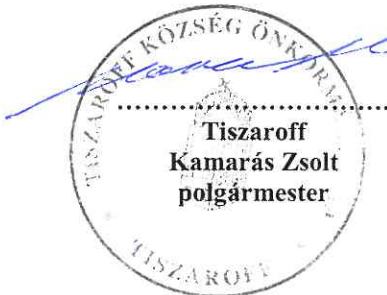
Tiszaroff Kamarás Zsolt polgármester