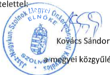
Kovács Sándor a megyei közgyűlés elnöke